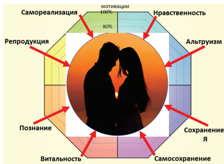
Рис. 1. Замыкание видов мотивации на предмете любви

Возможность фиксации различных видов мотивации на одном предмете является предпосылкой для возникновения феномена гомосексуальной любви. В целом ряде